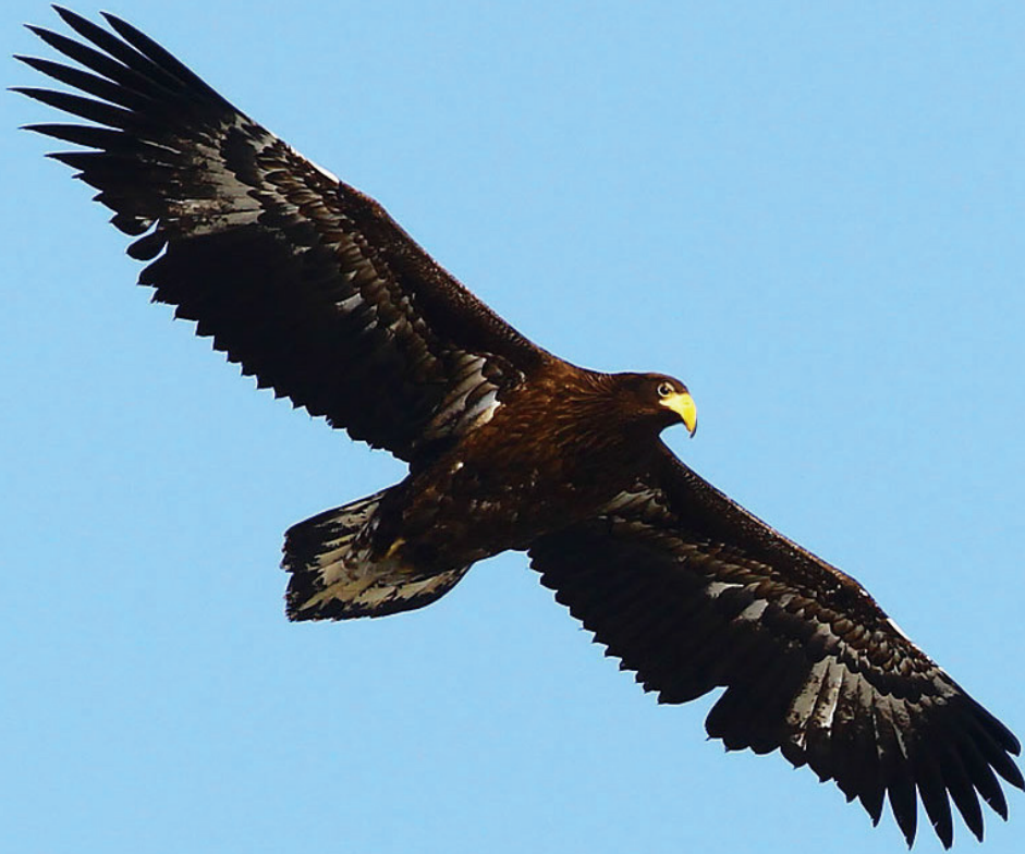
순천대학교 상징동물 독수리