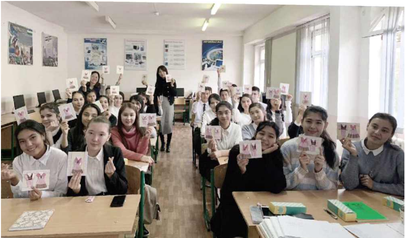
[우즈베키스탄 현지 한국어 특강]